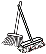
BROOM OR PUSH BROOM